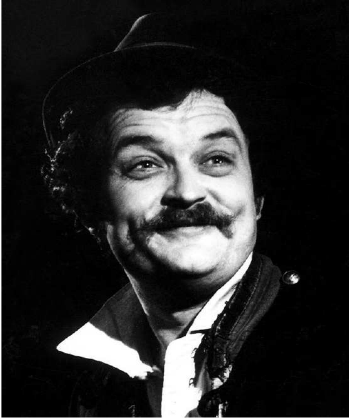
«Волки и овцы» А. Островского Режиссер – нар. арт. РСФСР В. А. Ефремова Аполлон – нар. арт. Российской Федерации К. Г. Юченков