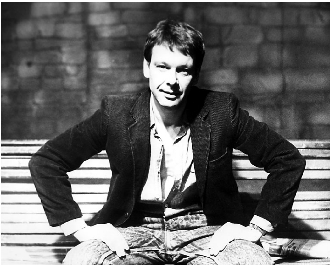
«Скамейка» А. Гельмана Режиссер – А. А. Сафронов Он – А. А. Сафронов