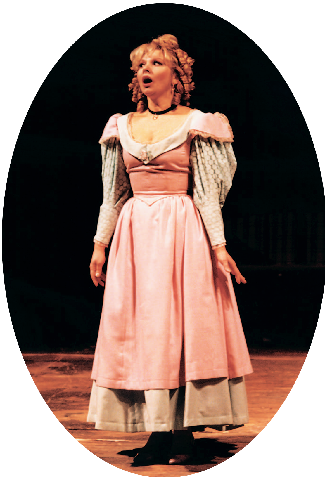
«Женитьба» Н. Гоголя. Режиссер – В. А. Персиков Агафья Тихоновна – арт. В. В. Мартыанова